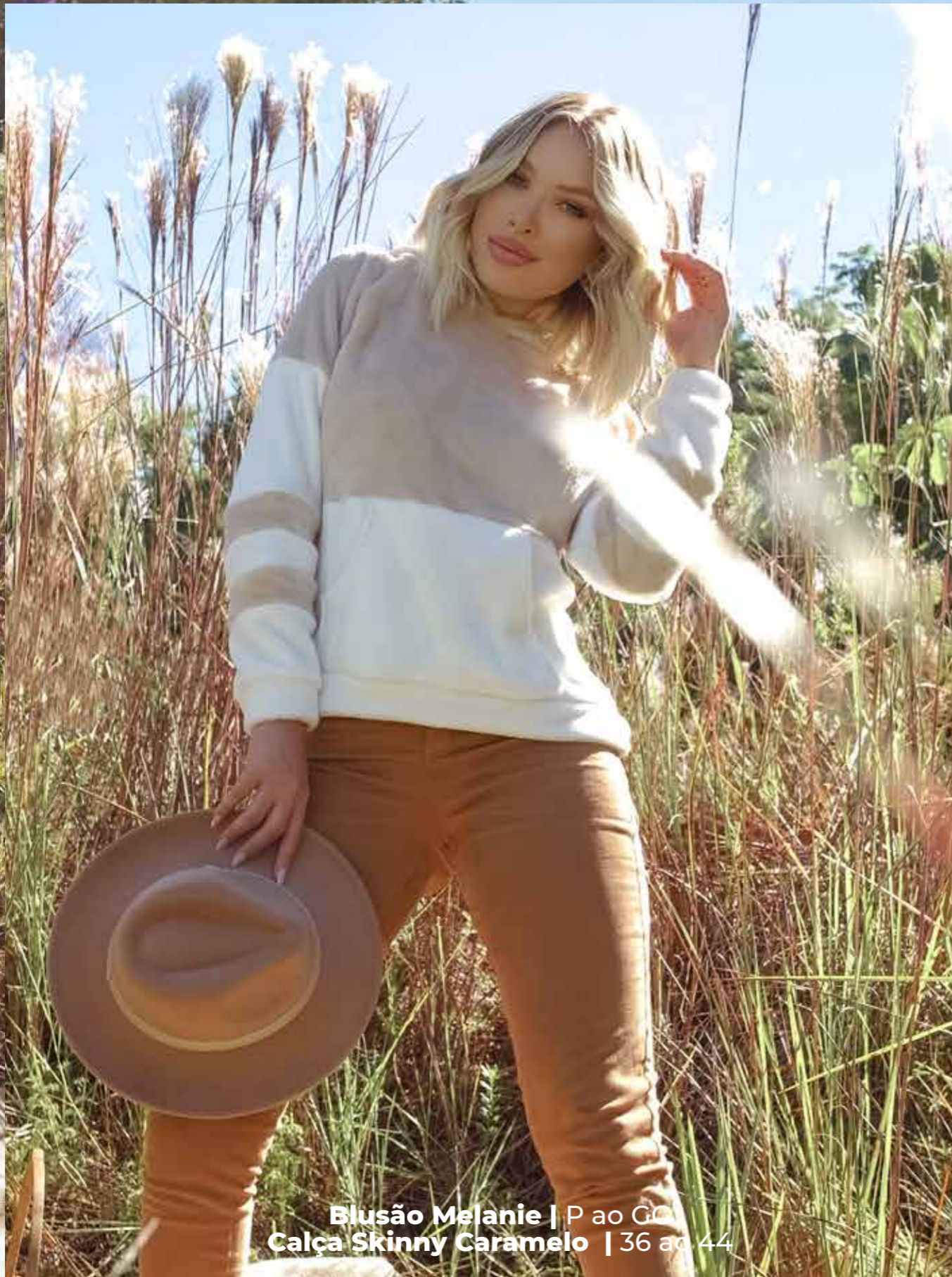
Blusão Melanie | P ao GG Calça Skinny Caramelo | 36 ao 44