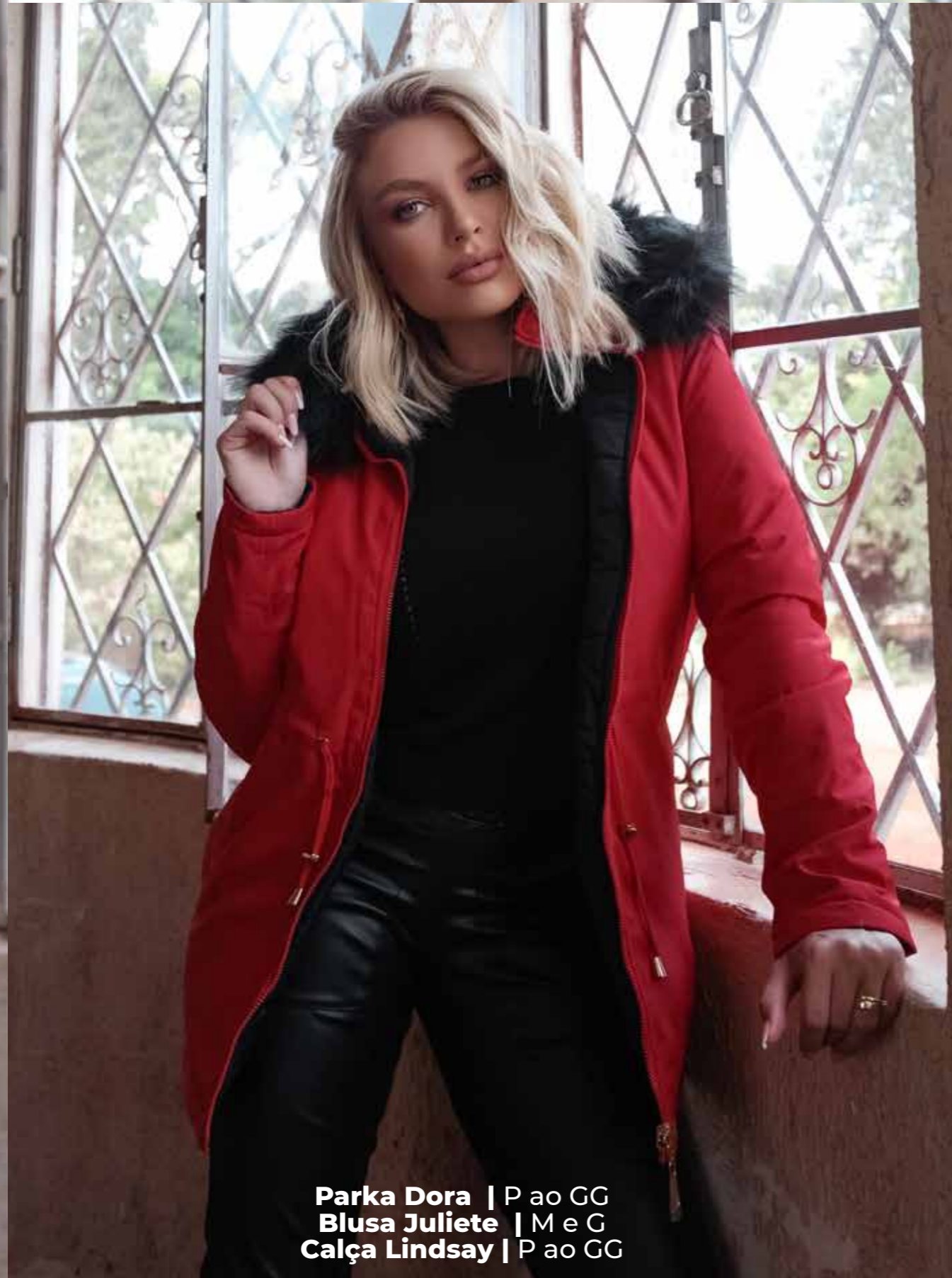
Parka Dora | P ao GG Blusa Juliete | M e G Calça Lindsay | P ao GG