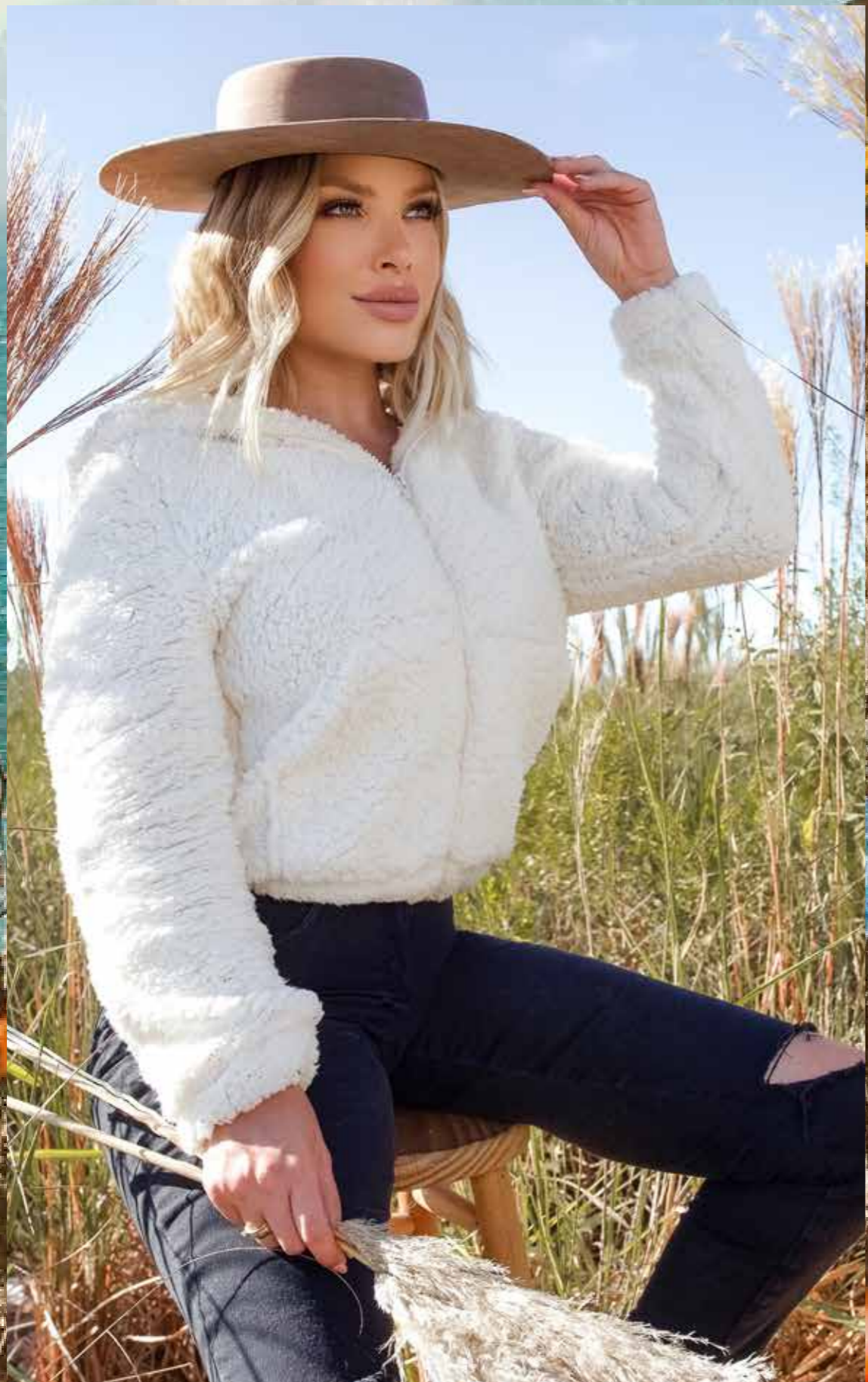
Jaqueta Leia | P ao GG Calça Skinny Rasgada | 36 ao 44