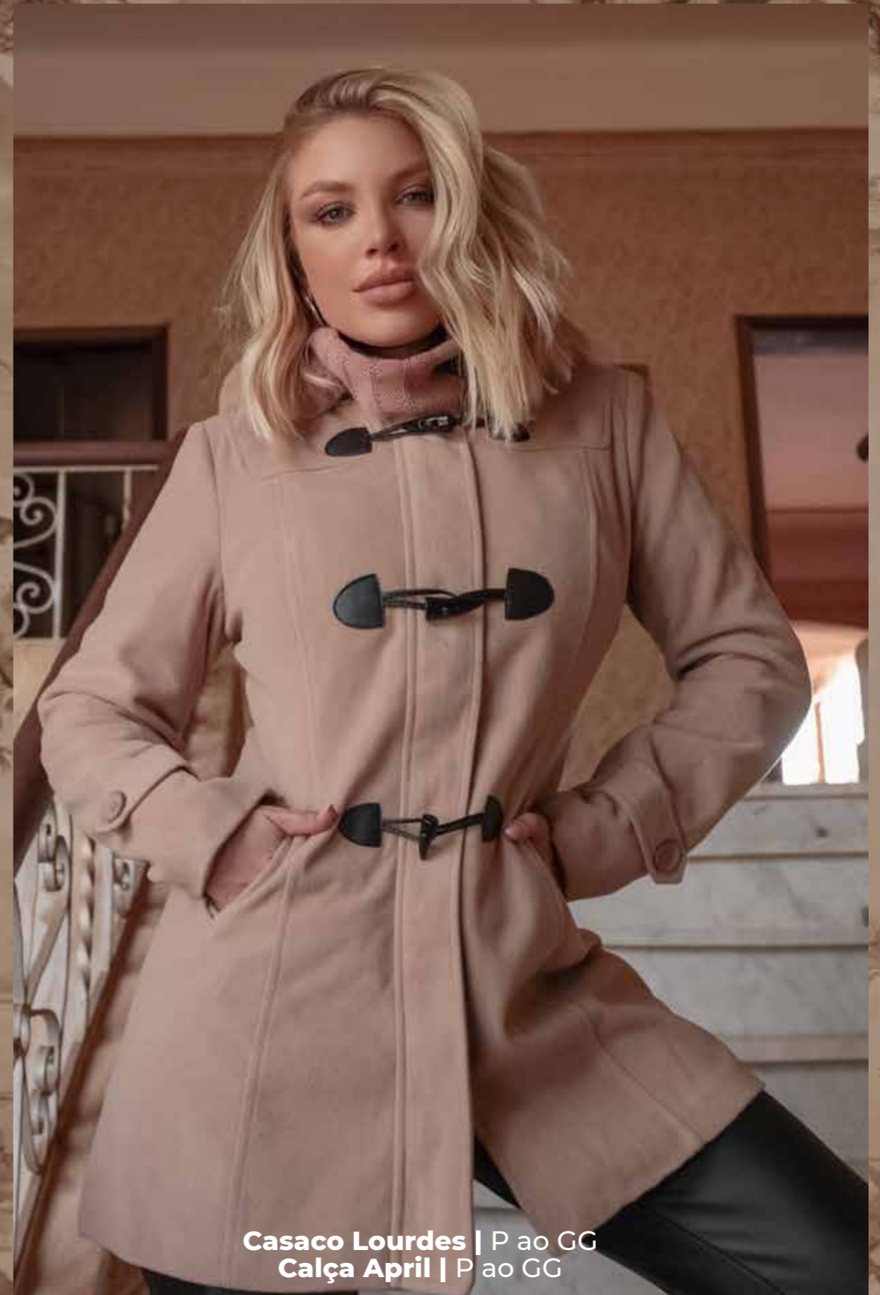
Casaco Lourdes | P ao GG Calça April | P ao GG