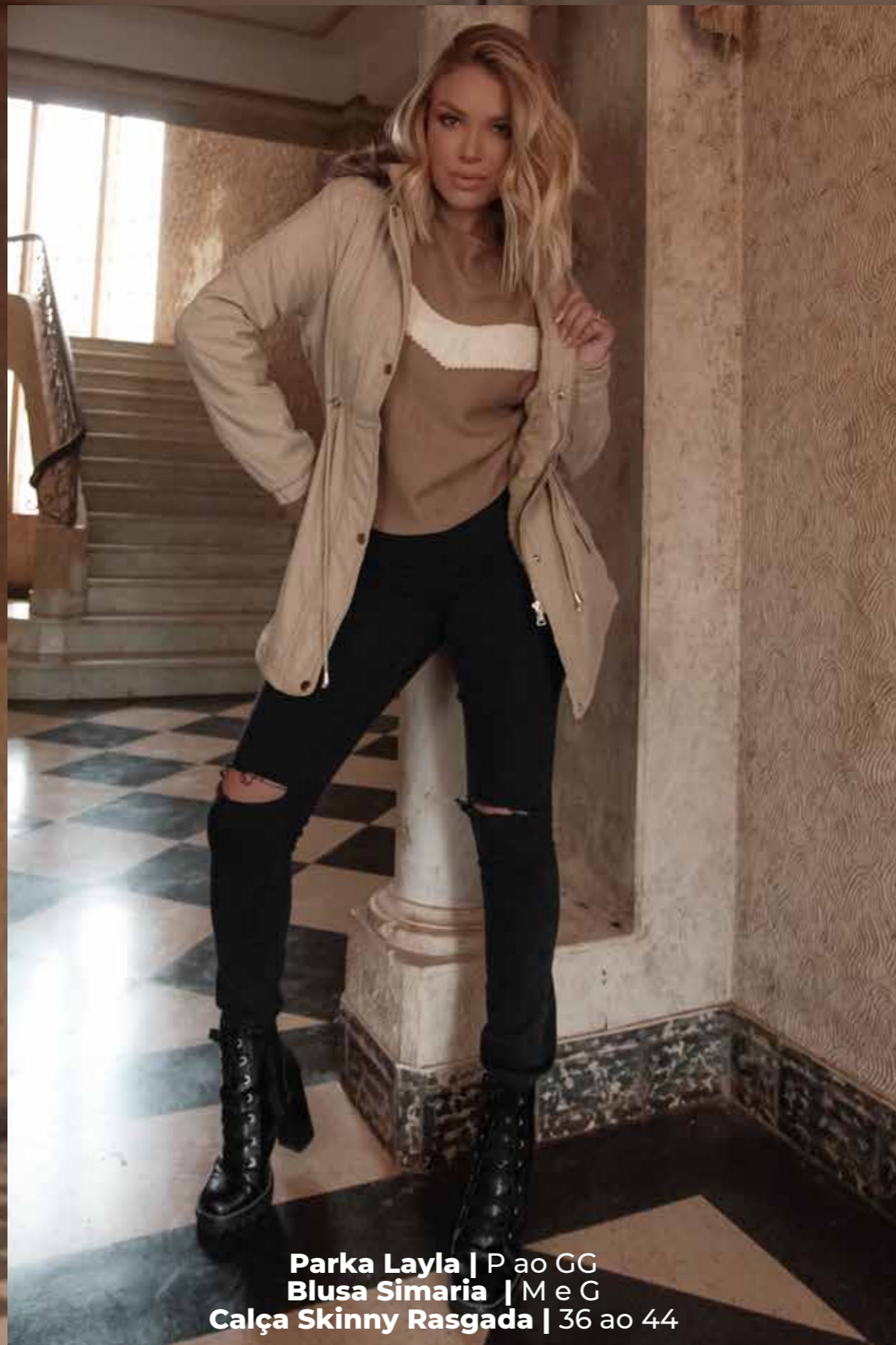
Parka Layla | P ao GG Blusa Simaria | M e G Calça Skinny Rasgada | 36 ao 44