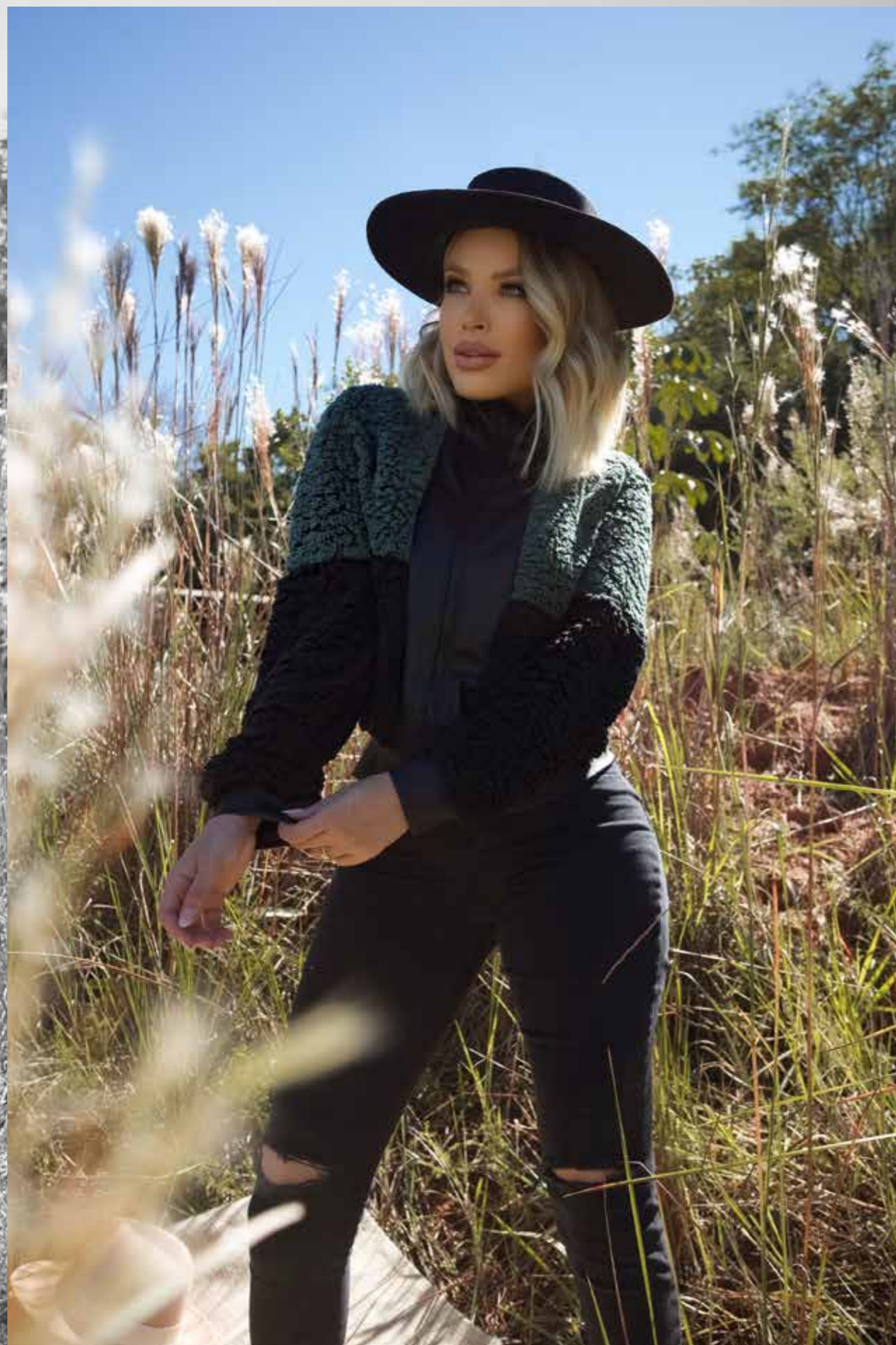
Jaqueta Marjorie | P ao GG Calça Skinny Rasgada | 36 ao 44