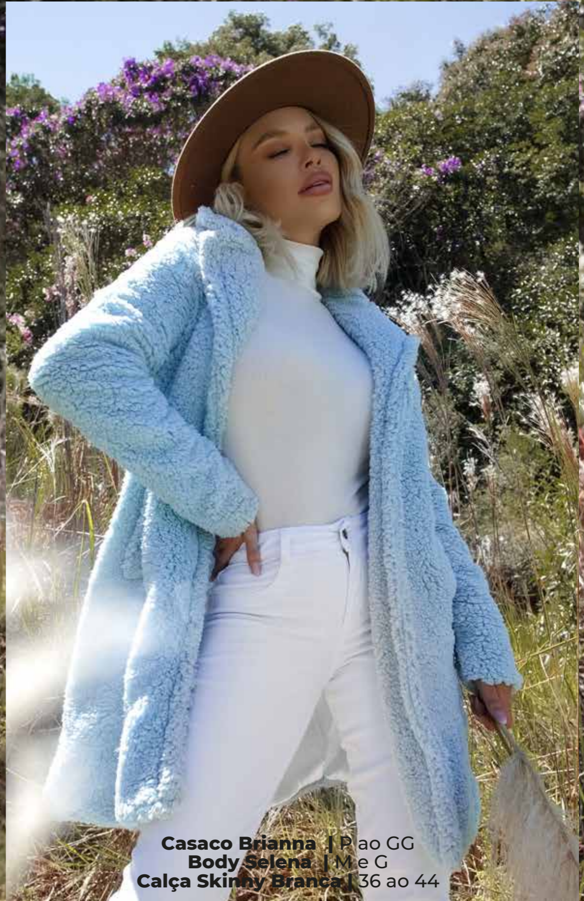
Casaco Brianna | Pão GG Body Selena | M e G Calça Skinny Branca | 36 ao 44