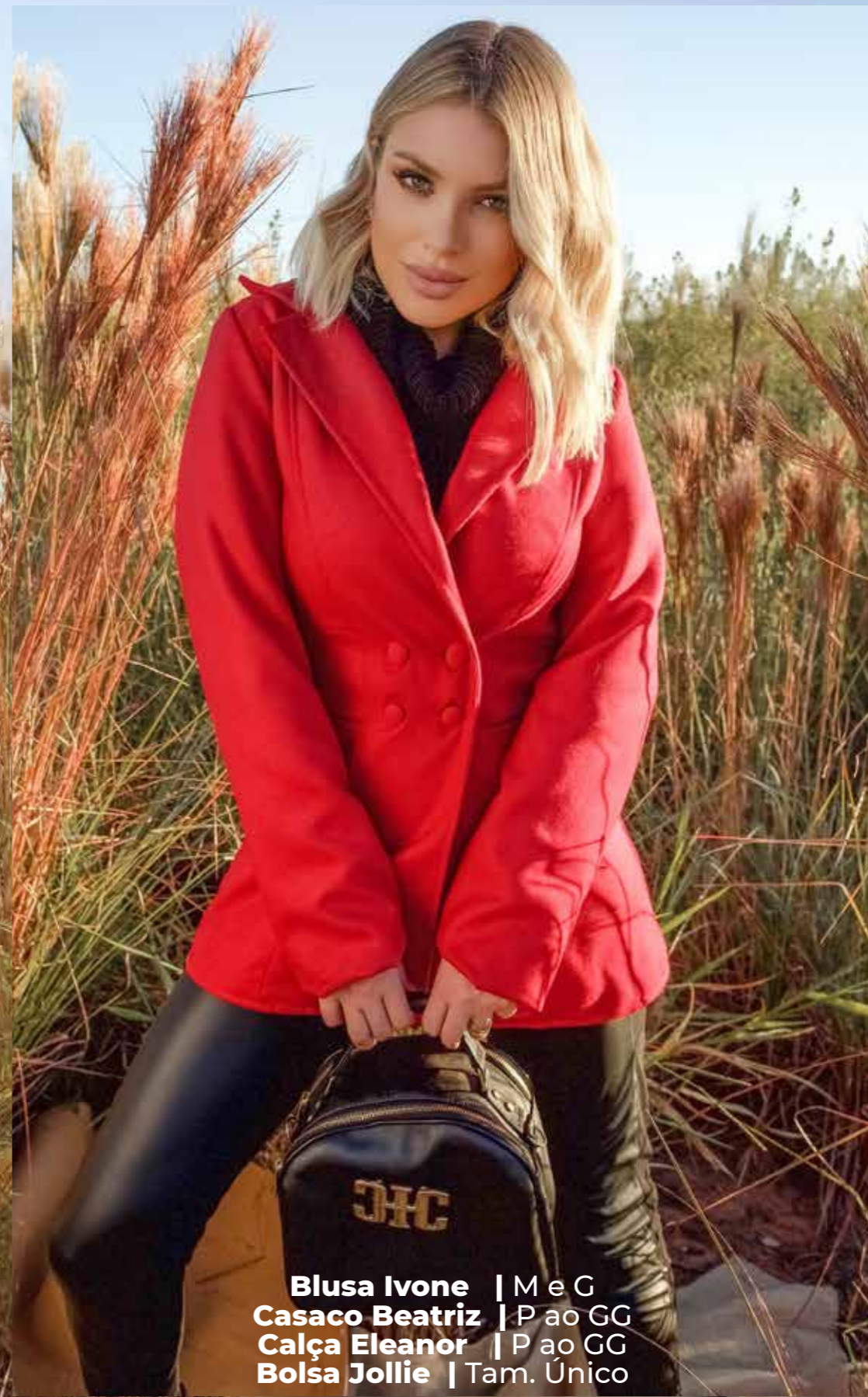
Blusa Ivone | M e G Casaco Beatriz | P ao GG Calça Eleanor | P ao GG Bolsa Jollie | Tam. Único