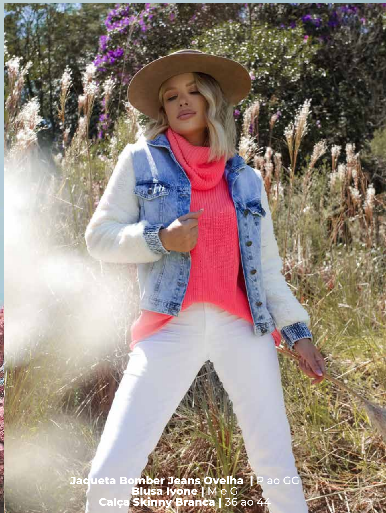
Jaqueta Bomber Jeans Ovelha | P ao GG Blusa Ivone | M e G Calça Skinny Branca | 36 ao 44