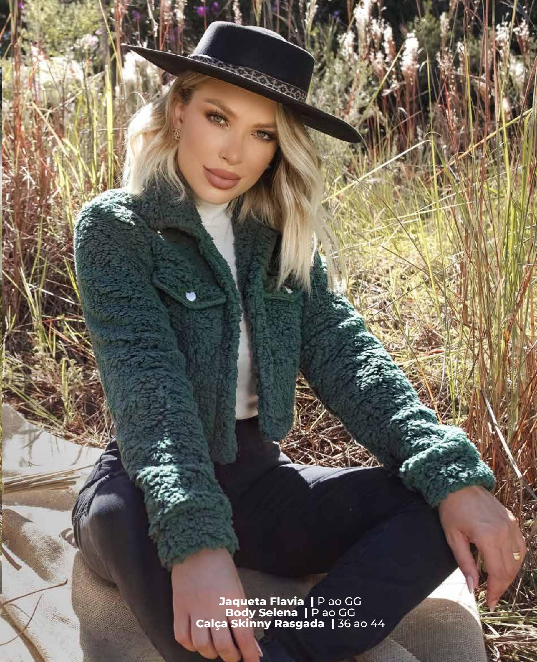
Jaqueta Flavia | P ao GG Body Selena | P ao GG Calça Skinny Rasgada | 36 ao 44