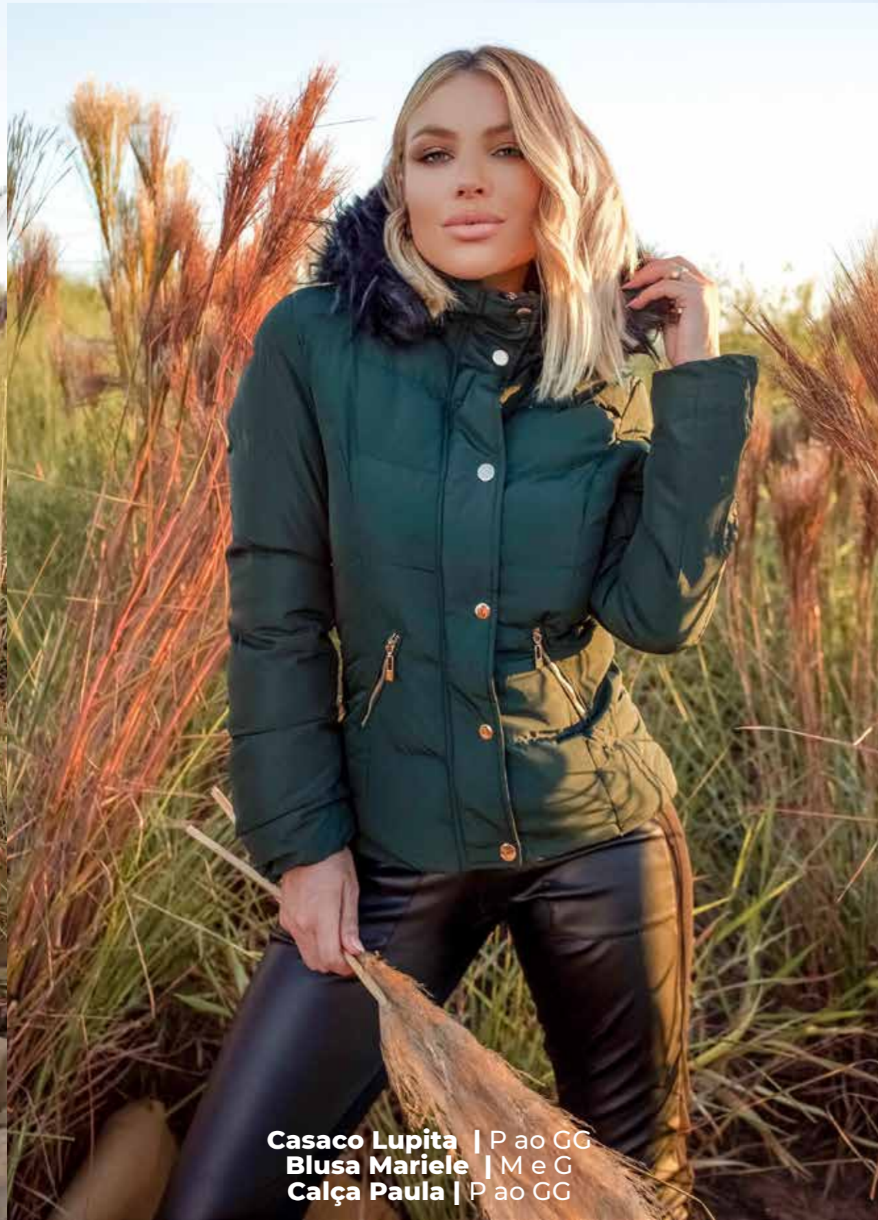
Casaco Lupita | P ao GG Blusa Mariele | M e G Calça Paula | P ao GG