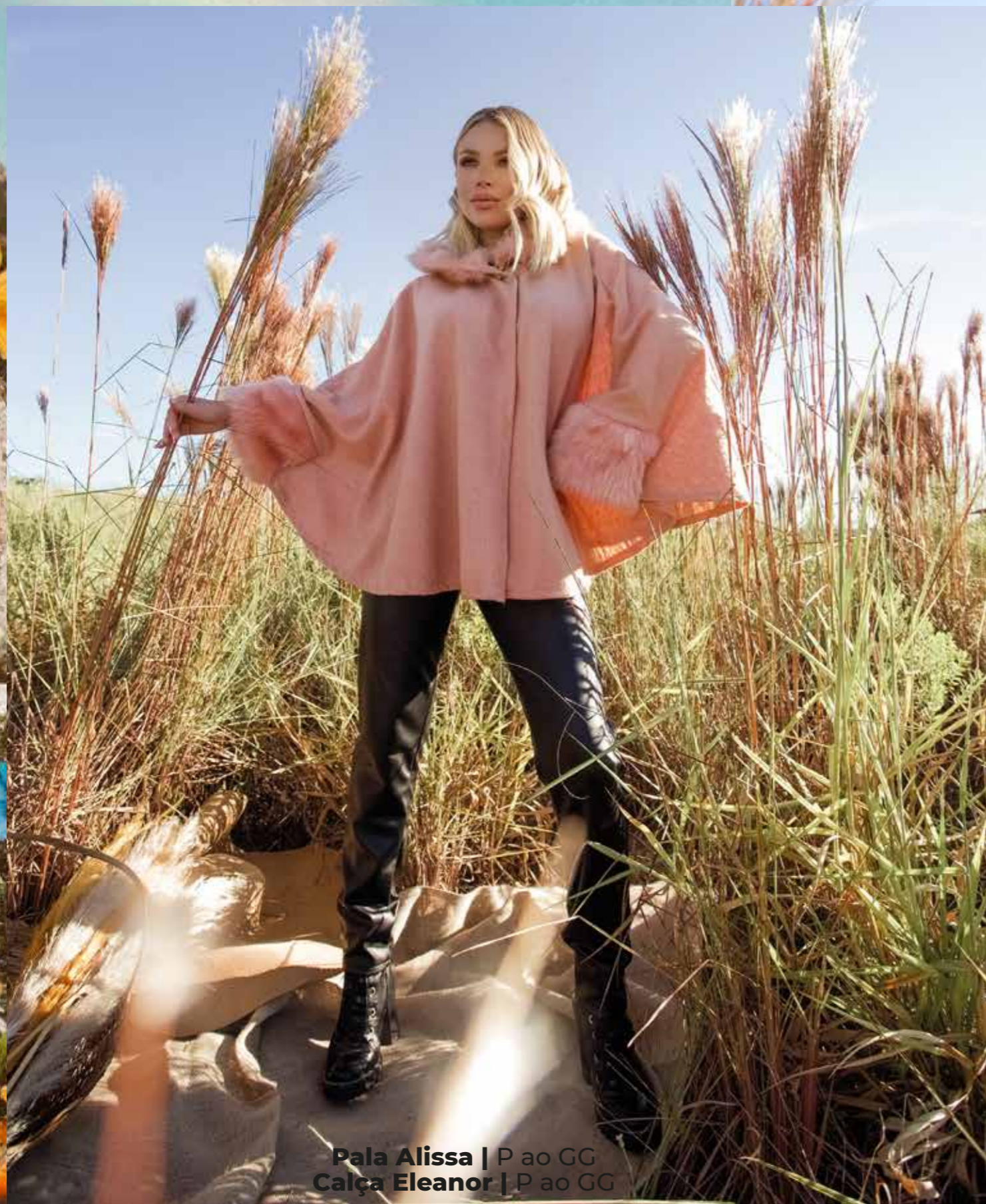
Pala Alissa | P ao GG Calça Eleanor | P ao GG

O calor do amor é tão vital quanto o calor do sol!