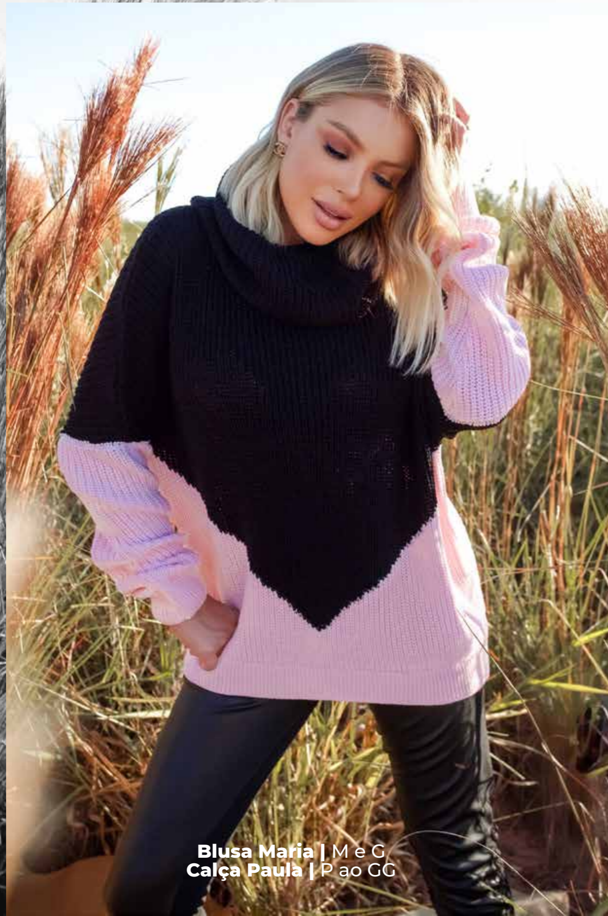
Blusa Maria | M e G Calça Paula | P ao GG