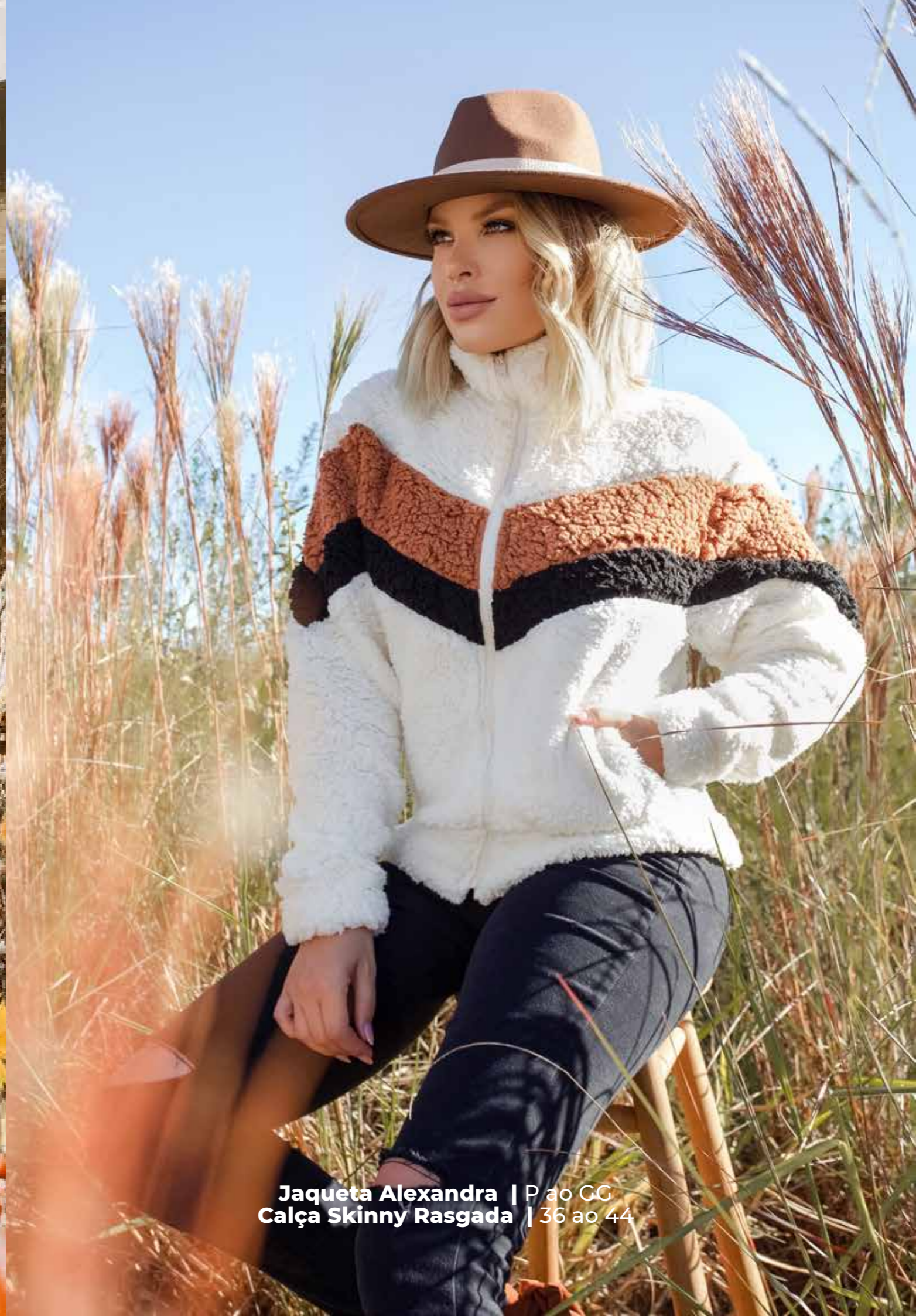
Jaqueta Alexandra | P ao GG Calça Skinny Rasgada | 36 ao 44