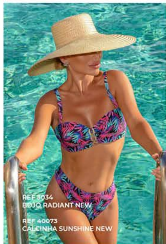
REF 5034 BOJO RADIANT NEW REF 40073 CALCINHA SUNSHINE NEW