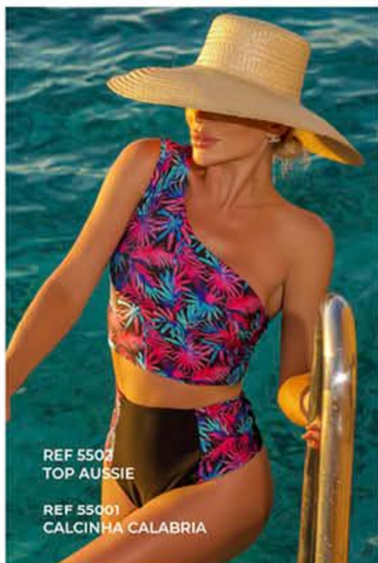
REF 5502 TOP AUSSIE REF 55001 CALCINHA CALABRIA