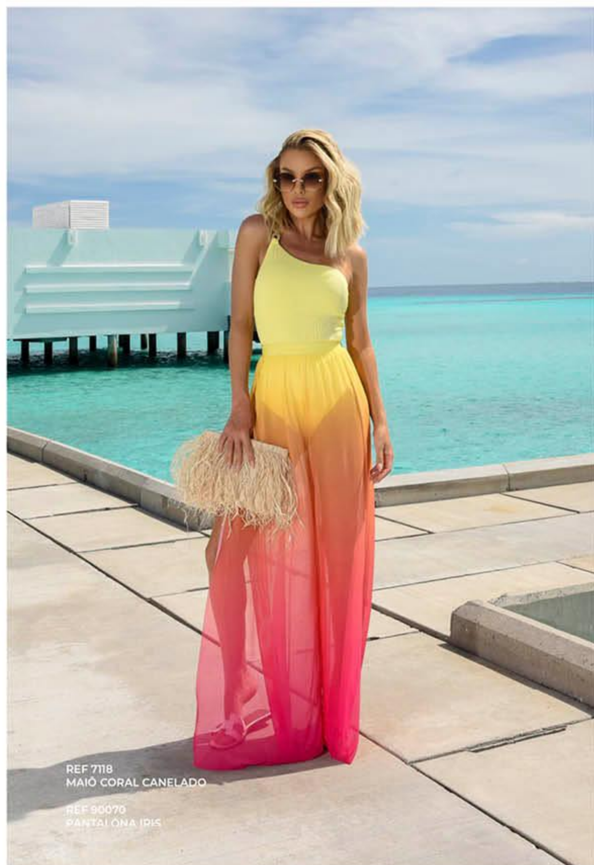
REF 7118 MAIÔ CORAL CANELADO REF 90070 PANTALONA IRIS