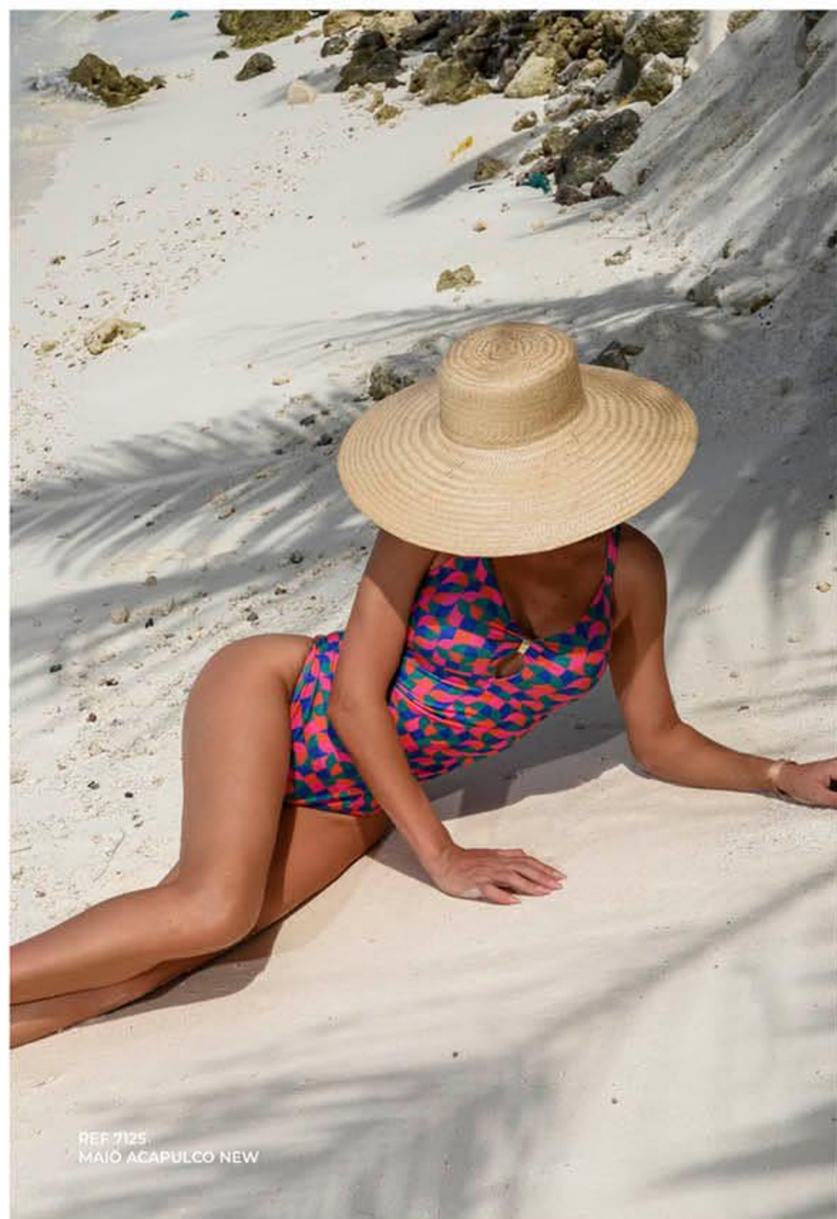
REF 7125 MAIO ACAPULCO NEW