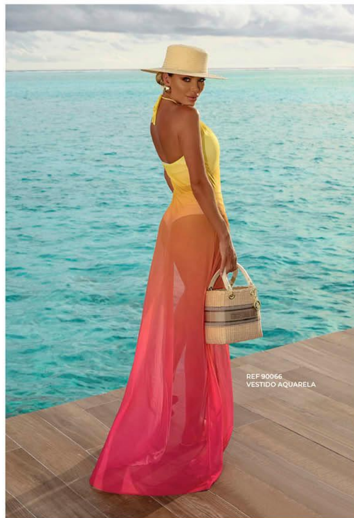
REF 90066 VESTIDO AQUARELA