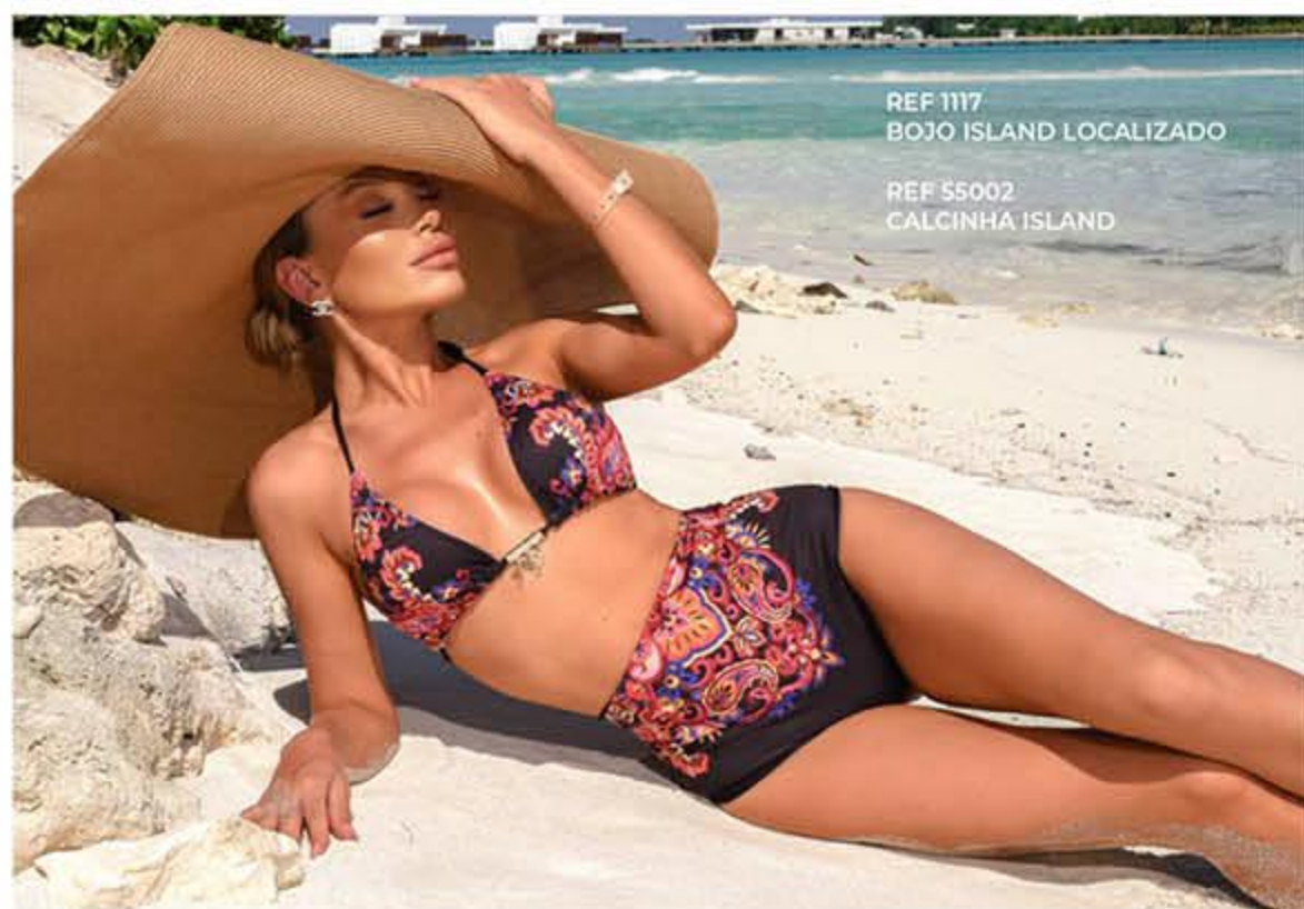
REF 1117 BOJO ISLAND LOCALIZADO REF 55002 CALCINHA ISLAND