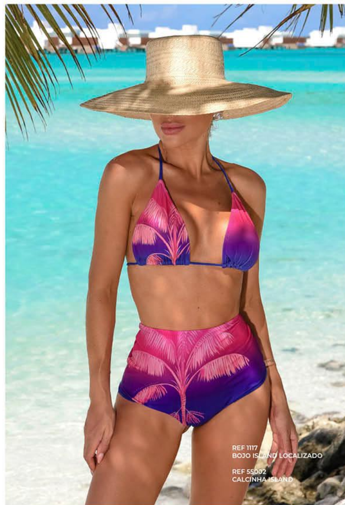
REF 1117 BOJO ISLAND LOCALIZADO REF 5502 CALCINHA ISLAND